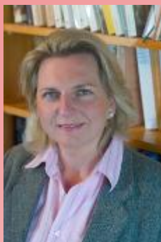
Dr. Karin Kneissl

In jedem Abschnitt ist Zeit für Debatten eingeplant.